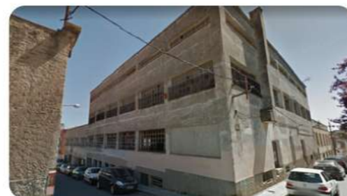
L'antiga fàbrica Superson, comprada per 1,5 milions d'€

Cal un Pla d'Equipaments, sí. És un full de ruta reclamat fa anys per l'AUP, que requereix d'un consens i d'una participació de la població que en cap cas s'ha donat.