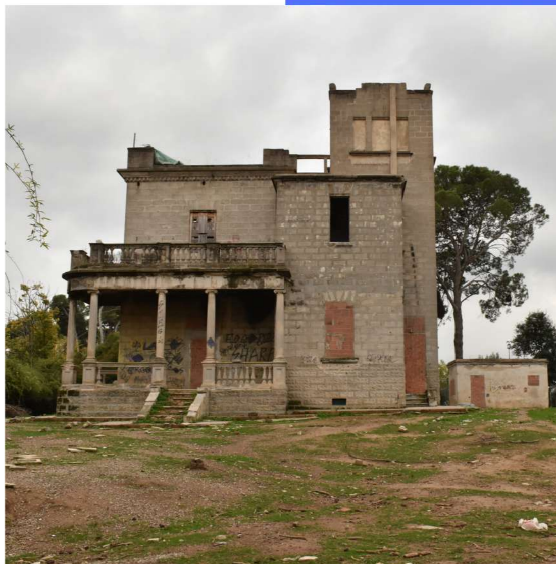
Una de les Torres, que forma part del conjunt Massana, a Ca n'Alzamora